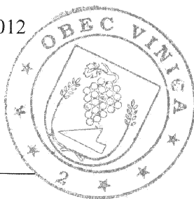
starosta / primátor